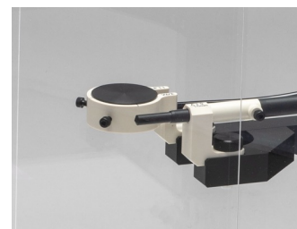
相互校正用ホルダー取付状態