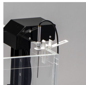
温度プローブ取付クリップ

記載内容は2024年4月1日現在のものです。 製品改良のため、仕様および外観の一部を予告なく変更することがあります。